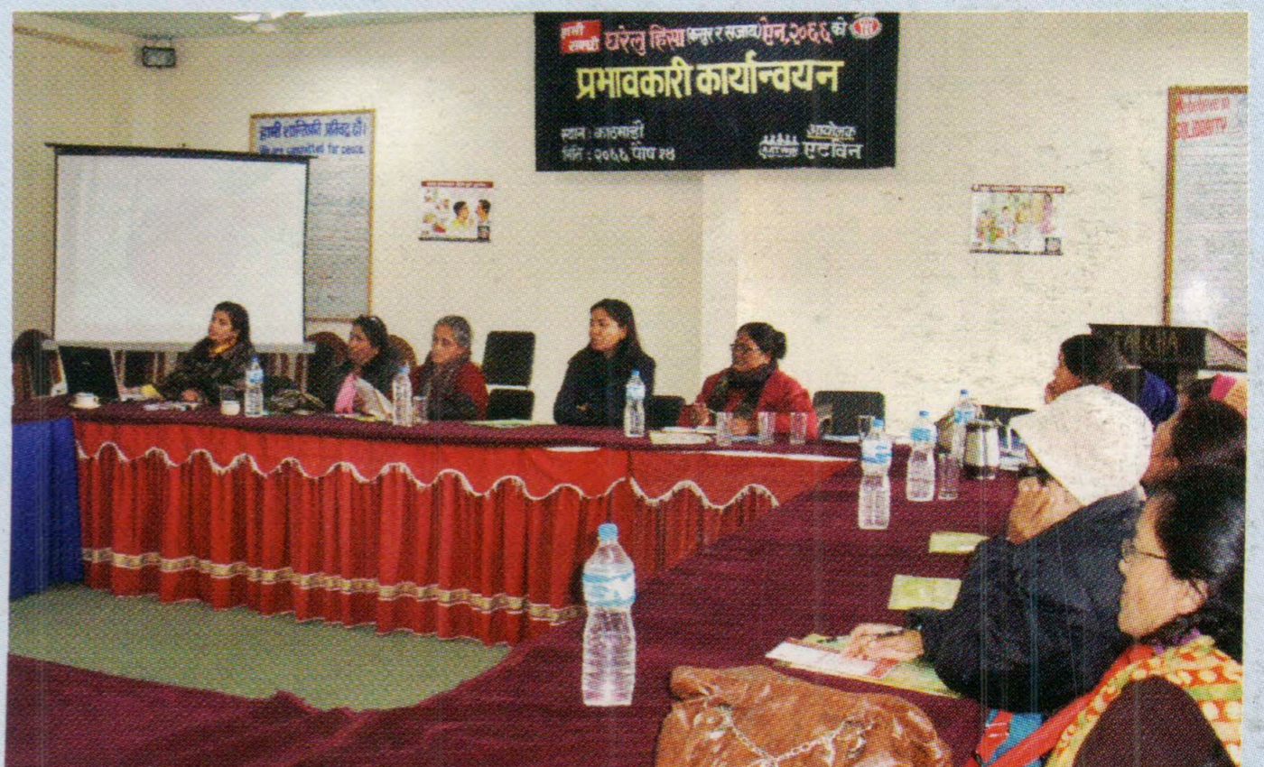
घरेलु हिंसा (कसुर र सजाय) ऐन, २०६६ सम्बन्धी अभिमुखीकरण कार्यशाला