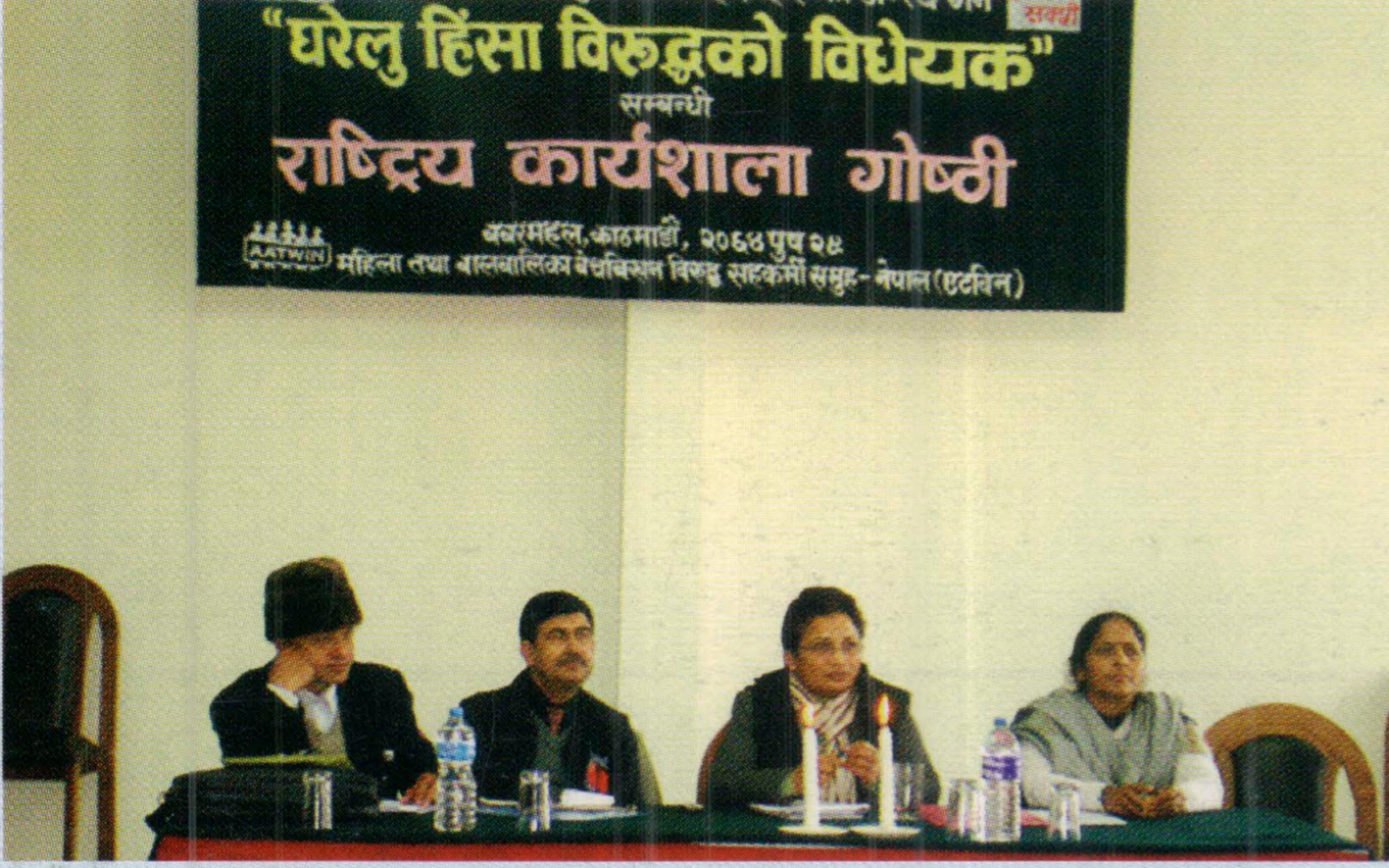
घरेलु हिंसाविरुद्धको विधेयक सम्बन्धी राष्ट्रिय कार्यशाला गोष्ठी