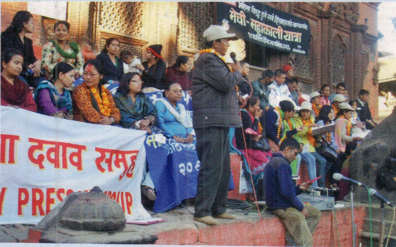
हामी सक्छौं मेची महाकाली यात्रा