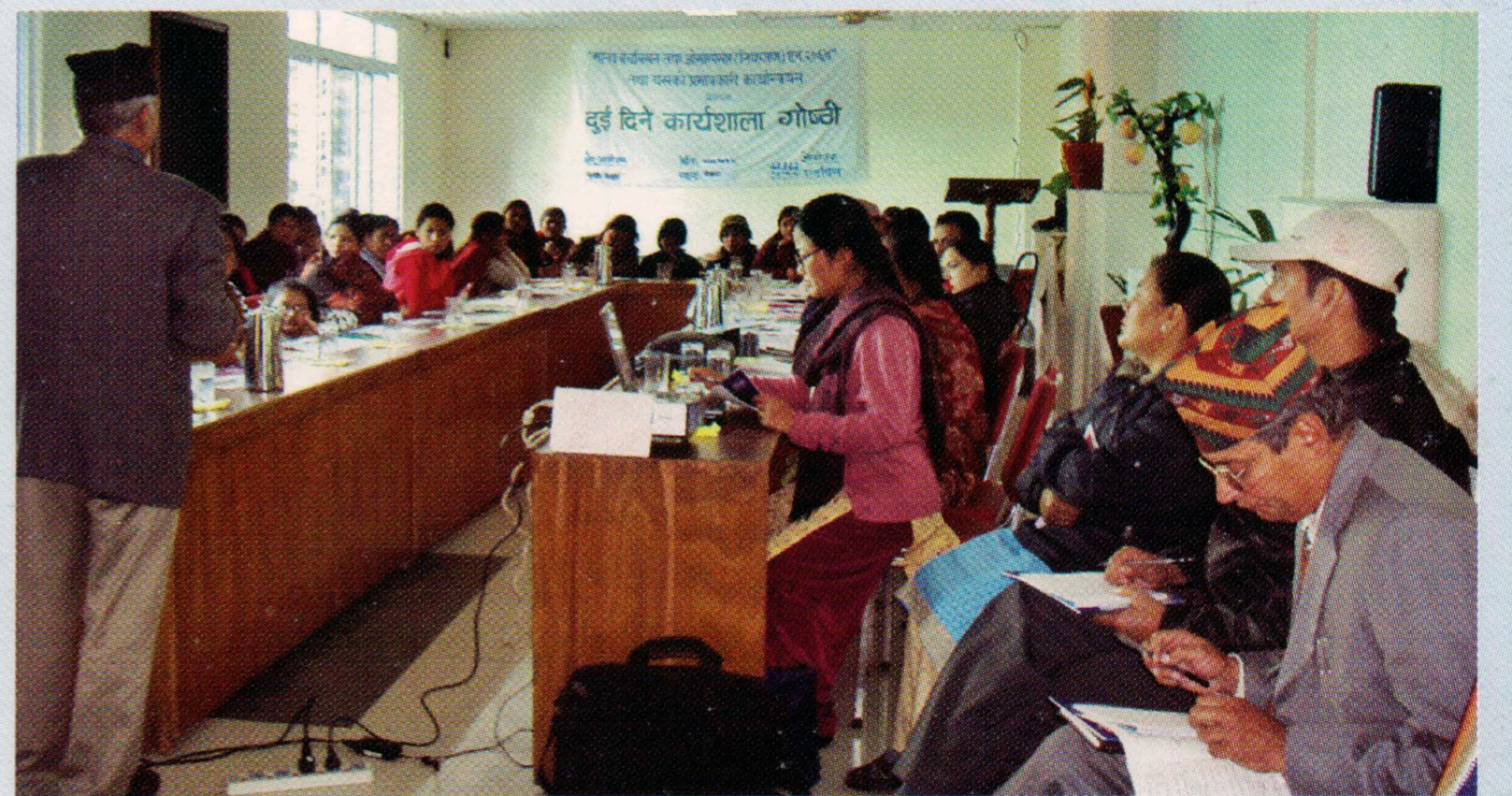
मानव बेचबिखन तथा ओसारपसार (नियन्त्रण) ऐन २०६४ तथा यसको प्रभावकारी कार्यन्वयन सम्बन्धी कार्यशाला, कास्की