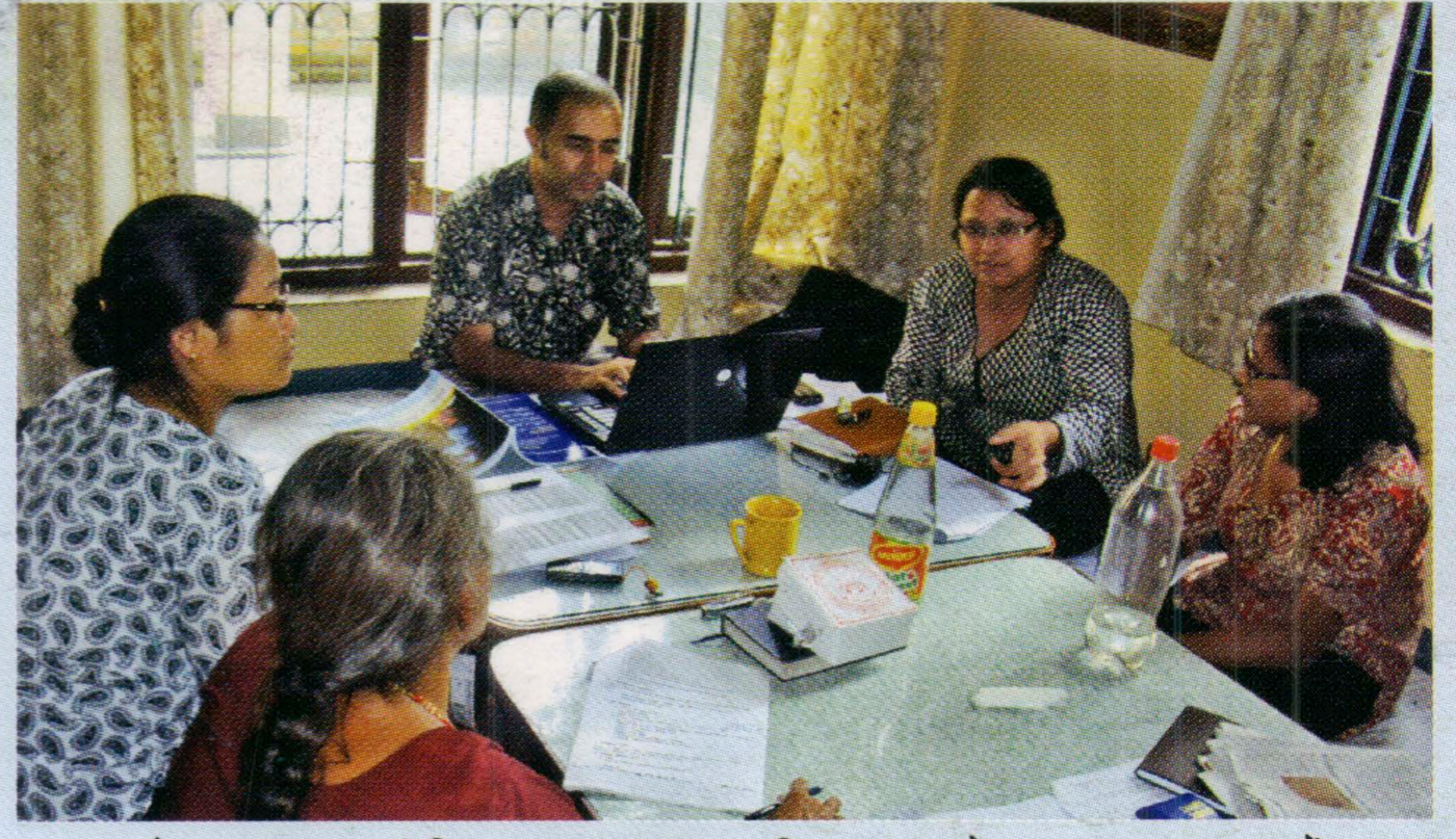
पाँच वर्षे रणनीतिक योजनाको अन्तिम मस्यौदामा छलफल गर्दै