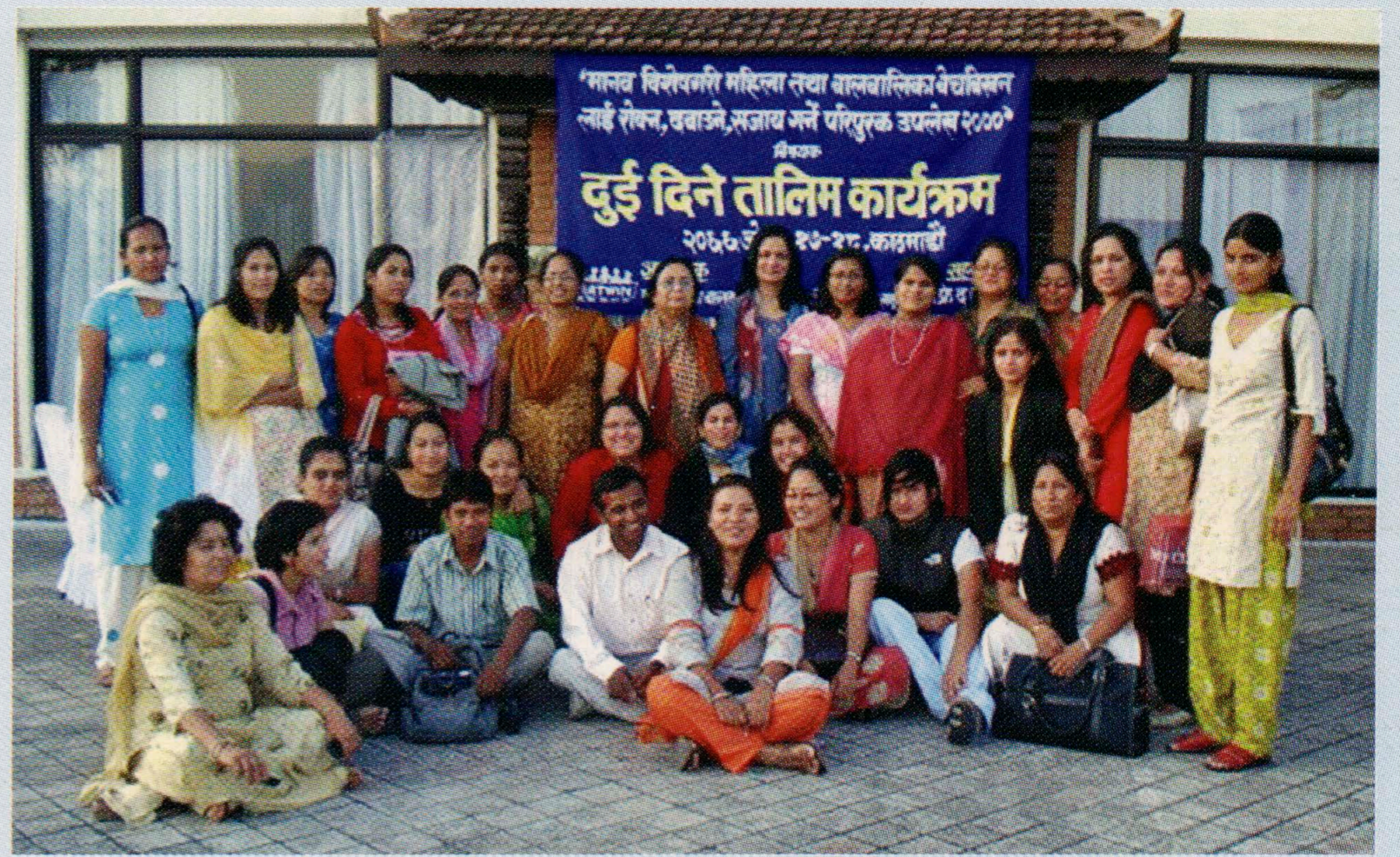
मानव बेचबिखनको युएन प्रोटोकल सम्बन्धी दुई दिने तालिम कार्यशाला