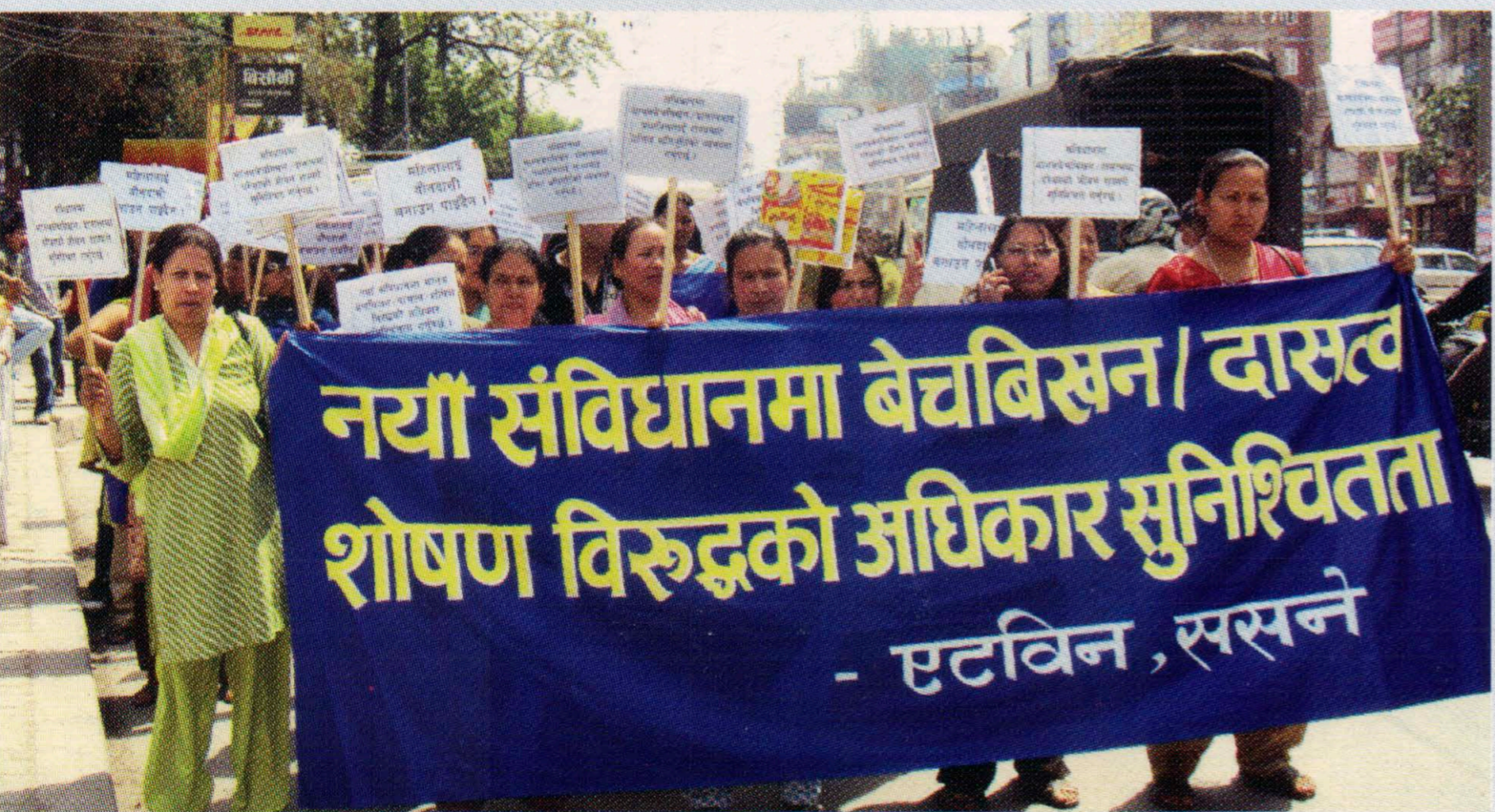
संविधानमा मानव बेचबिखन/दासत्व/शोषणविरुद्धको अधिकार सुनिश्चितताका लागि न्याली