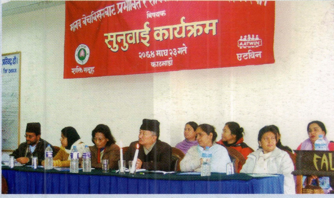
‘मानव बेचबिखनबाट प्रभावित तथा संविधानसभामा प्रभावितहरूको स्थान’ विषयक अन्तरक्रिया