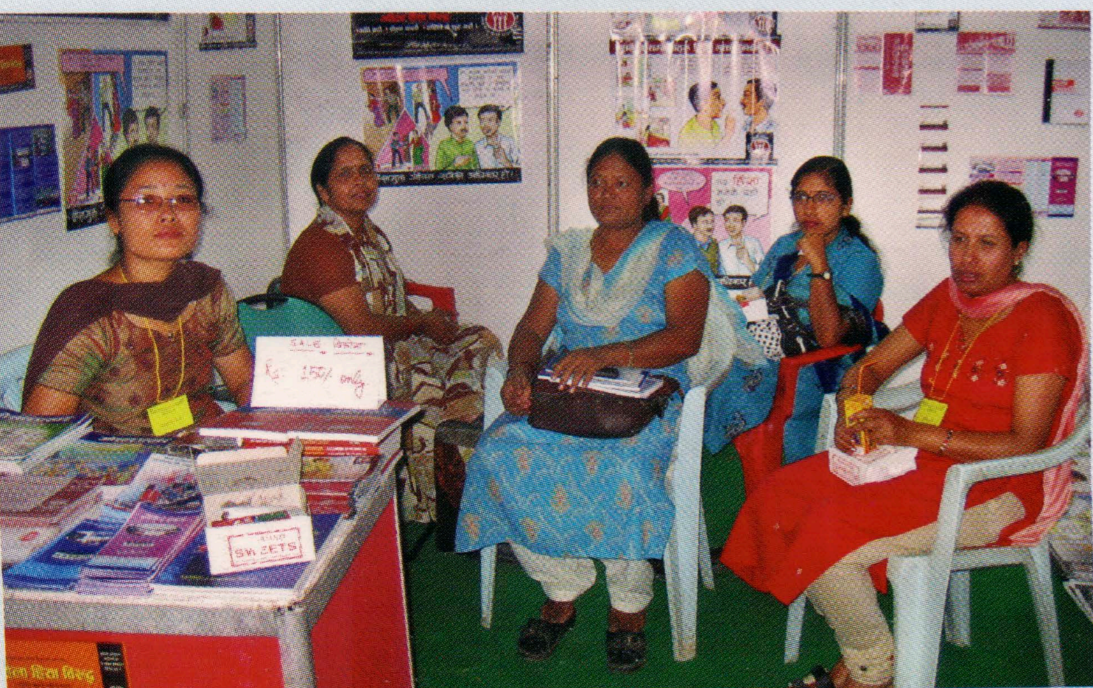
मानव बेचबिखनविरुद्धको राष्ट्रिय दिवसको अवसरमा स्टल प्रदर्शन