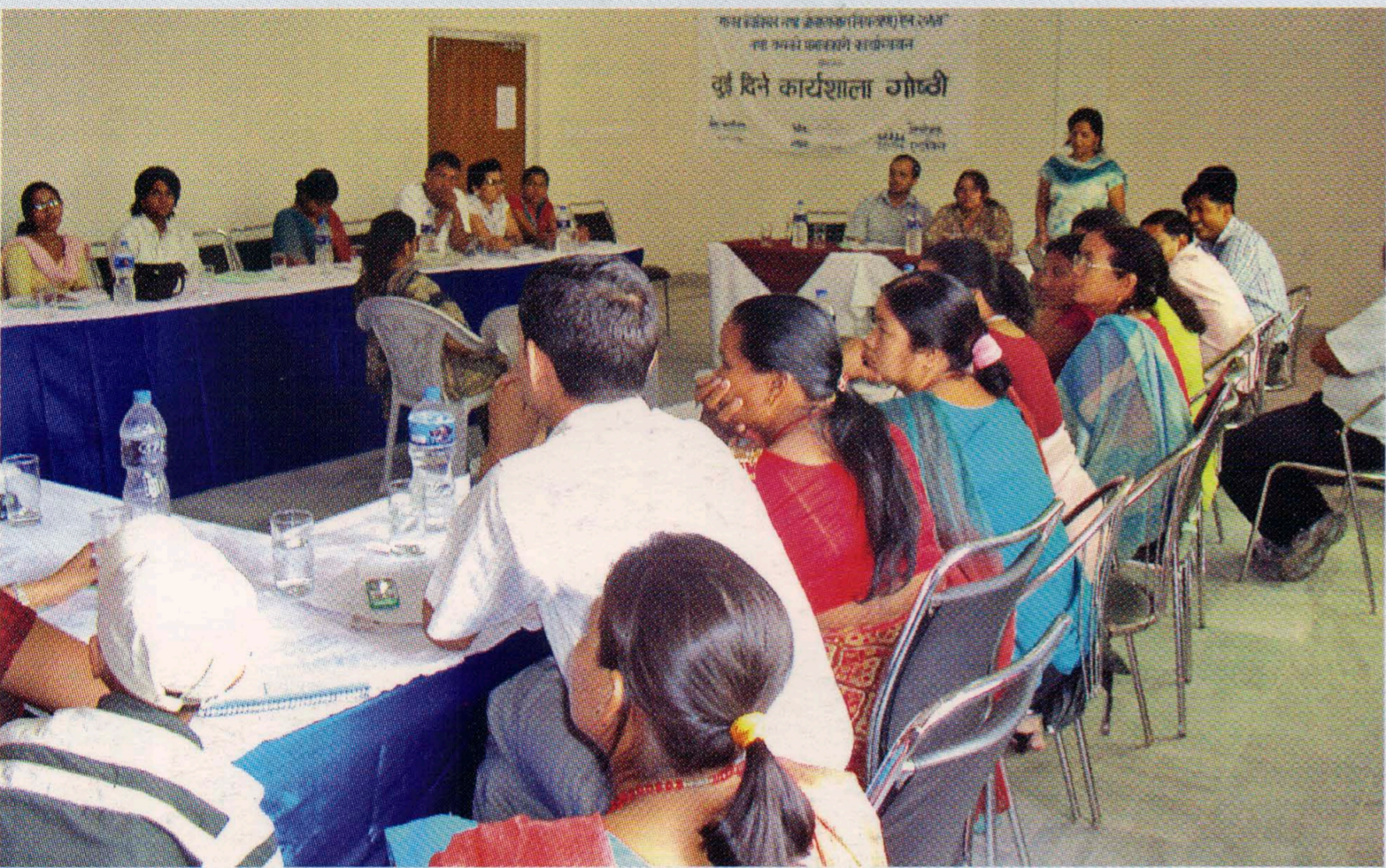
मानव बेचबिखन तथा ओसारपसार (नियन्त्रण) ऐन २०६४ तथा यसको प्रभावकारी कार्यन्वयन सम्बन्धी कार्यशाला, कैलाली