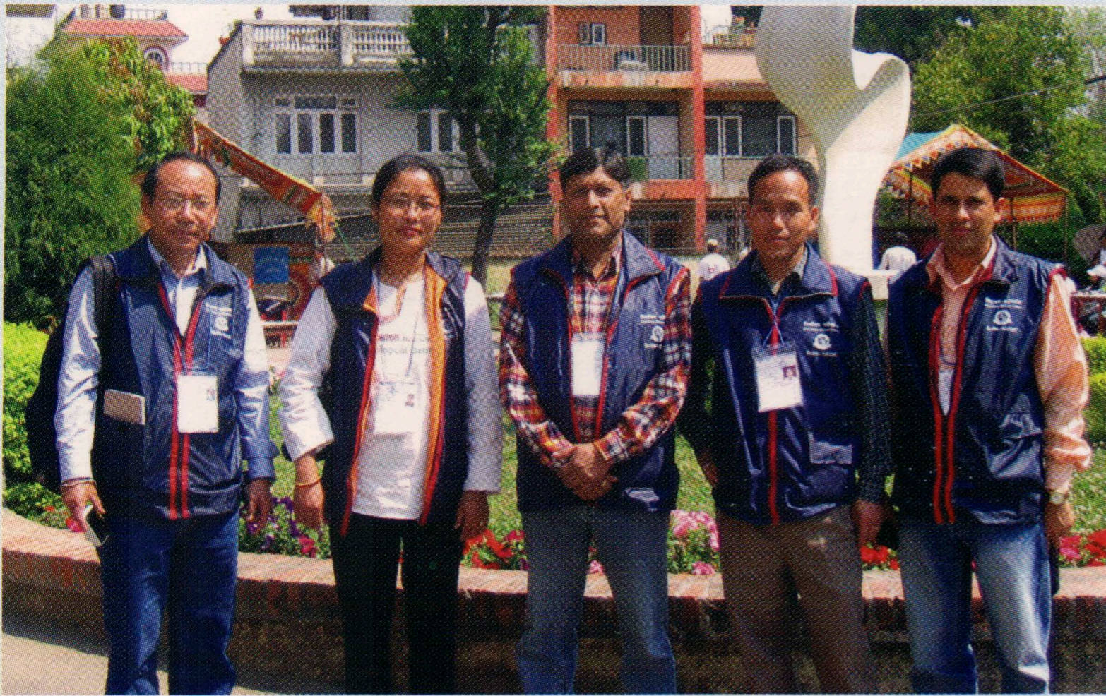
संविधानसभाको निर्वाचनमा पर्यवेक्षकको भूमिका निर्वाह गर्दै