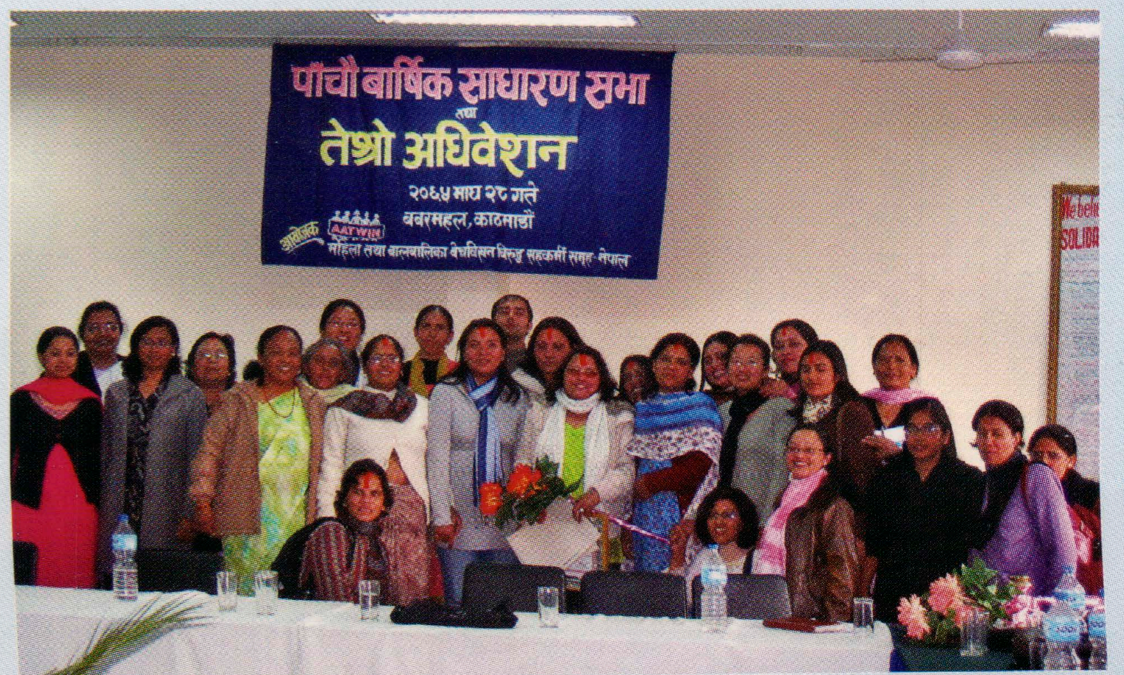
एटविनको पाँचौँ साधारण सभा तथा तेश्रो अधिवेशन