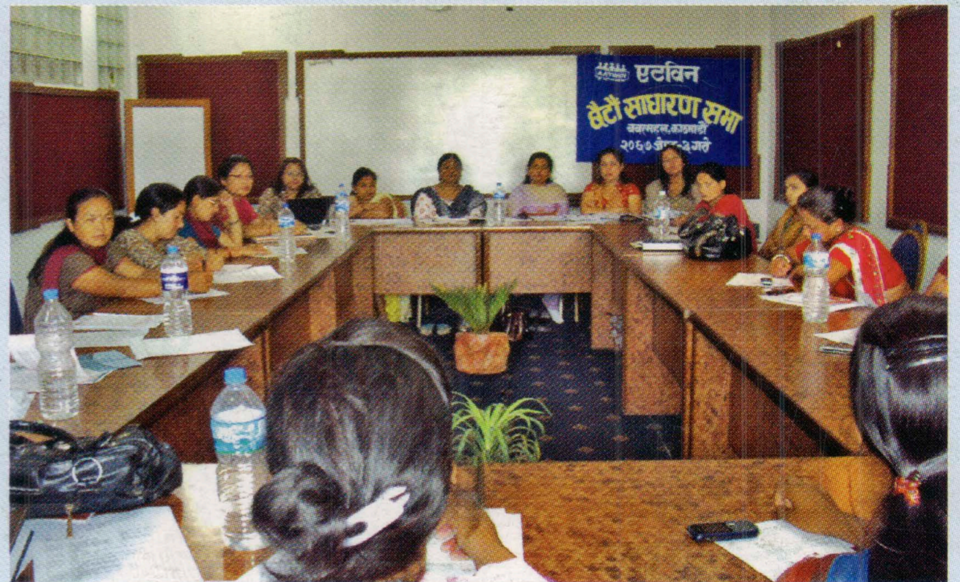
एटविनको छैटौं साधारण सभा