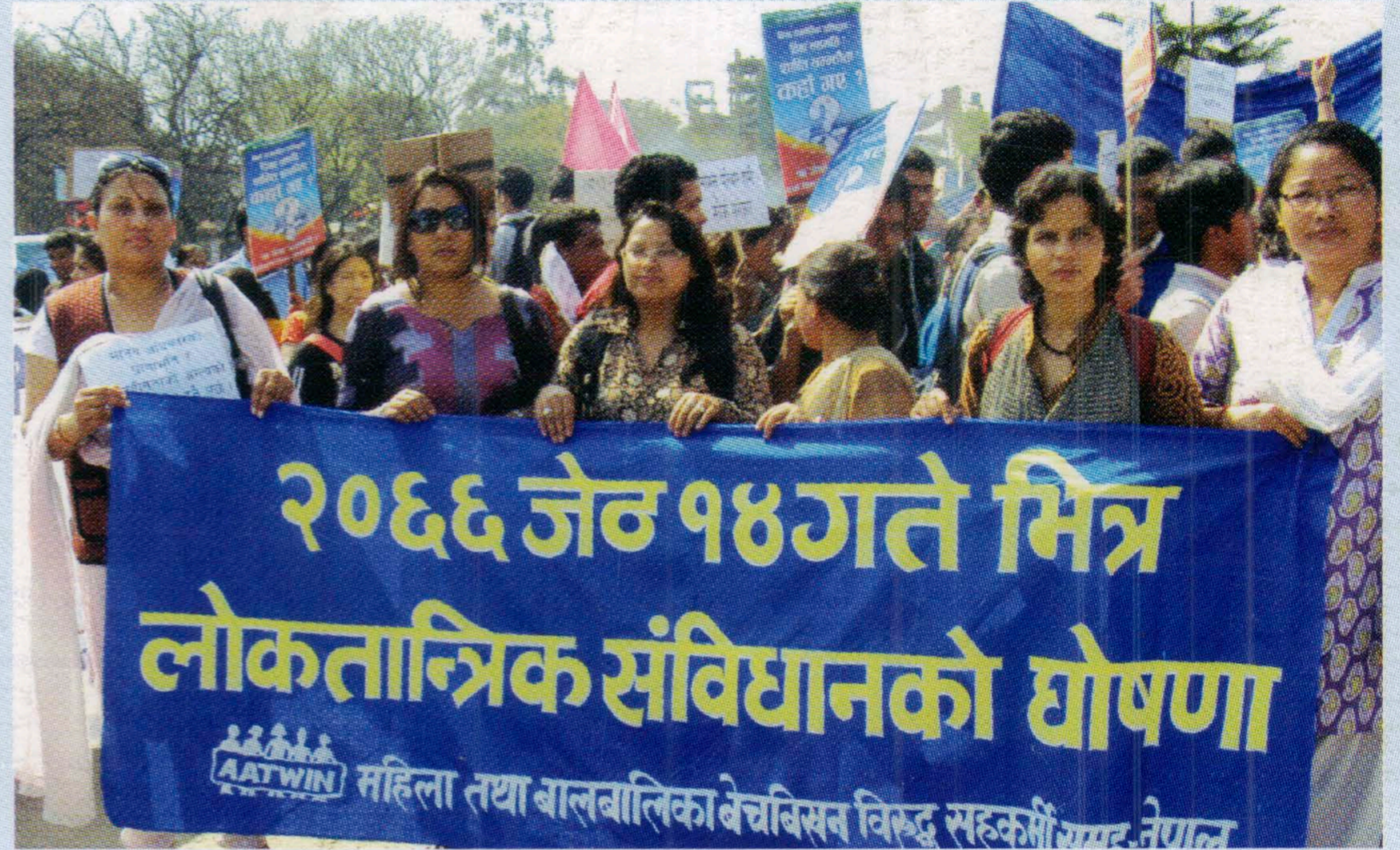
समयमा संविधानको घोषणा गर्न दबावमुलक ज्वाली