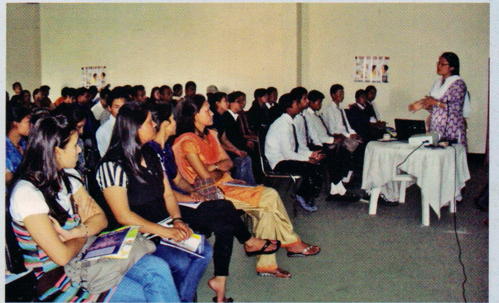
विद्यार्थी परिवर्तनका संवाहकको क्षेत्रीय भेला