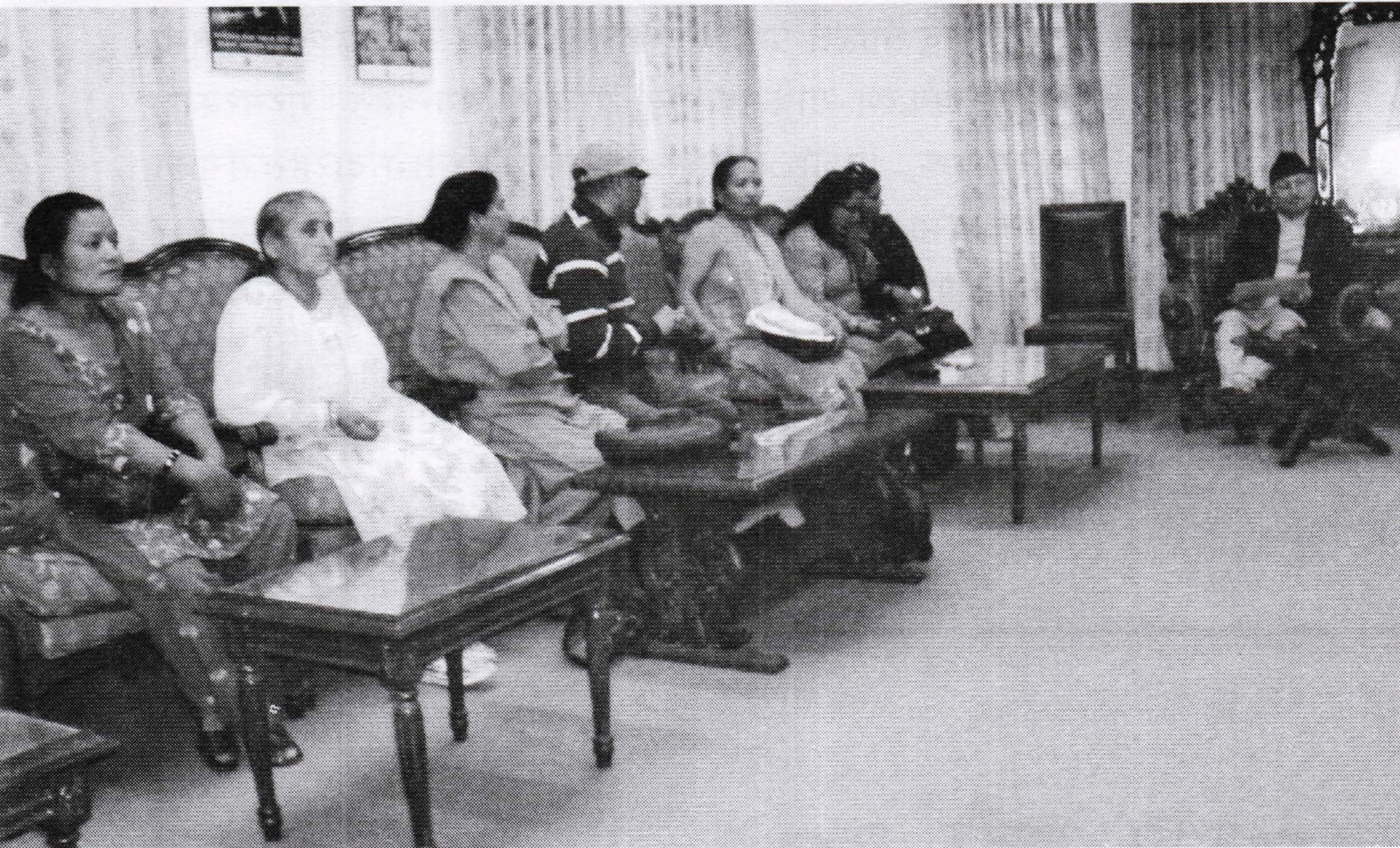
संविधानसभाका अध्यक्ष सुभाषचन्द्र नेम्वाङसमक्ष ज्ञापनपत्र बुझाउँदै एटविन प्रतिनिधि

मूलरूपमा नेपालको अन्तरिम संविधान २०६३ ले समानता लगायत महिलाको हक, बालबालिकाको हक, यातनाविरुद्धको हक, सामाजिक न्यायको हकलाई मौलिक अधिकारको रूपमा व्यवस्था गरेको छ। यसका अतिरिक्त उक्त संविधानले शोषणविरुद्धको हक अन्तर्गत प्रथा परम्परा र प्रचलनको नाममा कसैलाई शोषण गर्न नपाइने, मानिसलाई बेचबिखन वा दास बनाउन नपाइने तथा कसैको इच्छा विपरित काममा लगाउन नपाइने व्यवस्था गरेको छ। उक्त व्यवस्थालाई थप स्पष्ट बनाई सम्बन्धित सर्वसाधारणले सहजै बुझ्न सकिने रूपमा नेपालको नयां संविधानमा व्यवस्था हुनु जरुरी देखिएको हुँदा यो ज्ञापन पत्र माफत सुझावहरू