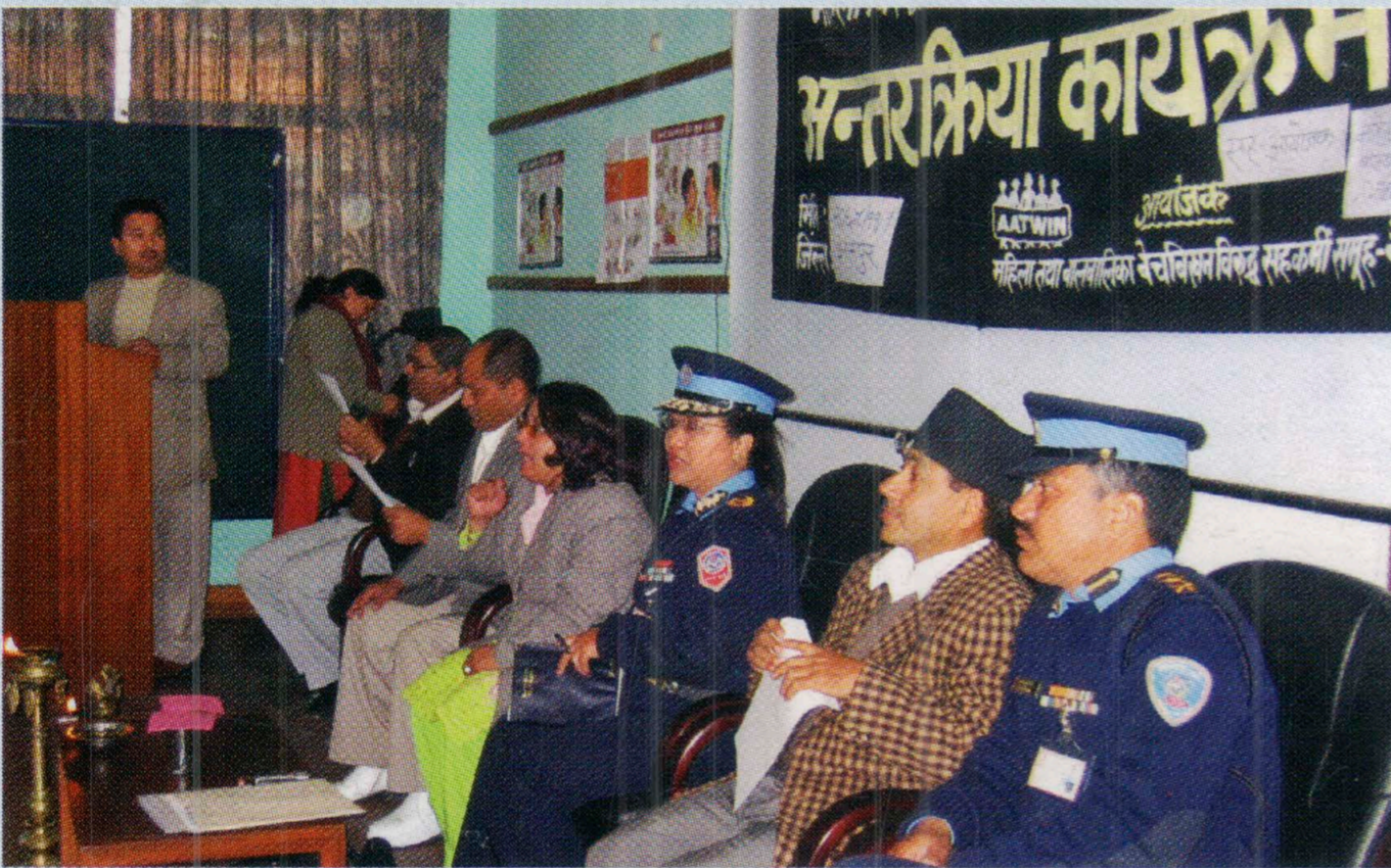
महिलाविरुद्ध हुने हिंसासम्बन्धी प्रहरीसँग अन्तरक्रिया, भक्तपुर, २००८